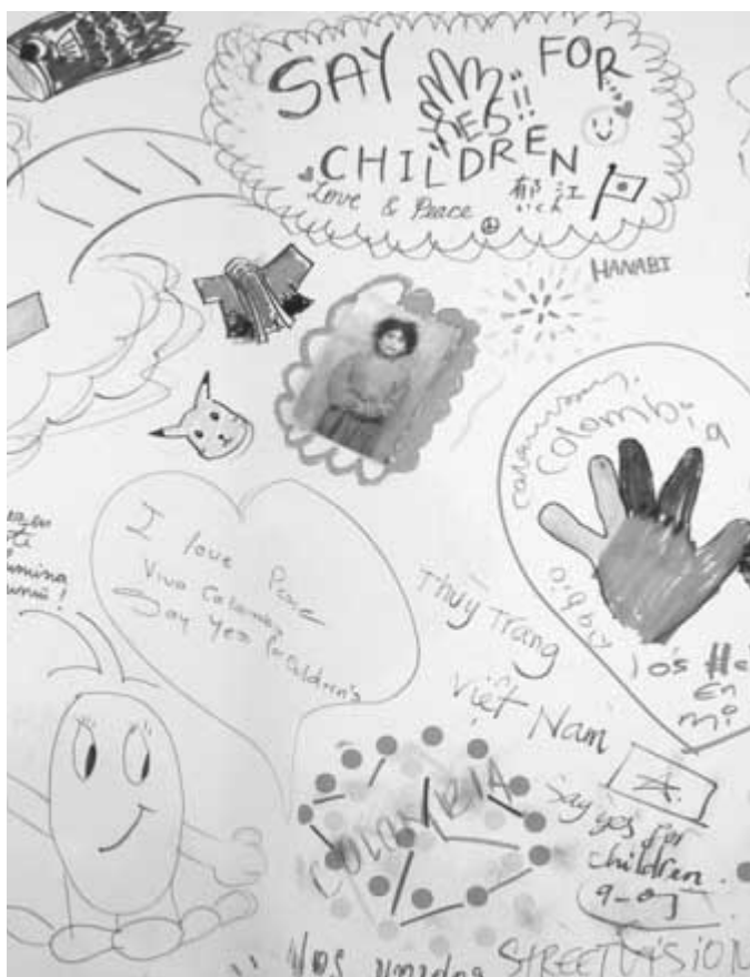
Detalle del cartel de tres metros y medio que anunciaba el Foro de la Infancia, sobre el que los más de 400 delegados de 154 países tuvieron la oportunidad de escribir y dibujar mensajes.

La idea de una participación infantil significativa en el ámbito internacional se puso en práctica por primera vez en la Sesión Especial de las Naciones Unidas en favor de la Infancia. Nunca antes habían participado tantos niños en una reunión de ese nivel, y los resultados fueron espectaculares. Desde los diálogos intergeneracionales al Consejo de Seguridad, los niños se encontraban en todas partes y expresaron sus opiniones y se hicieron tomar en serio.